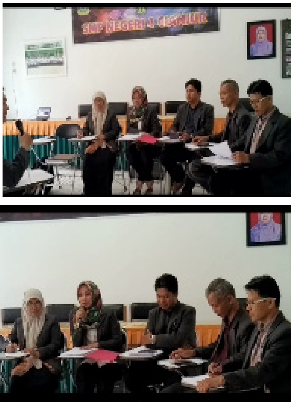
Gambar 5. Sesi See Kegiatan Lesson Study

merefleksi pembelajaran oleh guru model oleh guru, mahasiswa dan peneliti seperti terlukis dalam Gambar 5. Guru model menyampaikan terlebih dahulu refleksi pembelajaran yang dilakukannya, kemudian pengamat melaporkan hasil pantauannya. Kemudian, guru model bersama dengan pengamat merangkun dan menyimpulkan pembelajaran yang mereka peroleh dari kegiatan Lesson Study saat itu serta menyampaikan masukannya untuk kegiatan Lesson Study pada siklus berikutnya.