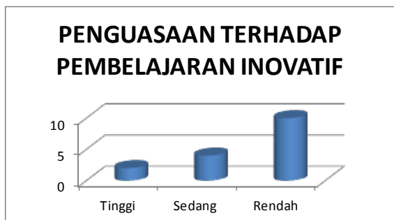
Gambar 1. Kualifikasi Penguasaan Guru terhadap Beragam Pembelajaran Inovatif

Berdasarkan Gambar 1, terlihat bahwa terdapat 2 orang guru yang penguasaannya tinggi, 4 orang guru penguasaannya sedang dan 10 orang guru penguasaannya rendah. Para guru umumnya hanya menguasai pembelajaran ekspositori. Bahkan, guru masih kebingungan mengimplementasikan Pendekatan Saintifik di kelas. Demikian pula pengetahuan guru tentang belajar berkelompok masih terbatas pada jenis belajar berkelompok biasa tanpa mengikuti jenis belajar berkelompok tertentu. Selain itu, guru juga menyampaikan pendapatnya bahwa meskipun sekolah mereka dipakai untuk penelitian beberapa mahasiswa, tetapi guru di sekolah yang bersangkutan tidak dilibatkan dalam kegiatan penelitian mahasiswa. Demikian pula, mahasiswa peneliti tidak mensosialisasikan hasil penelitiannya dan tidak menyampaikan rekomendasi hasil penelitiannya kepada guru dan sekolah tempat mereka melakukan penelitian. Sebagai akibatnya, guru kurang merasakan manfaat penelitian yang dilakukan mahasiswa bagi penambahan wawasan mereka terhadap pembelajaran inovatif.