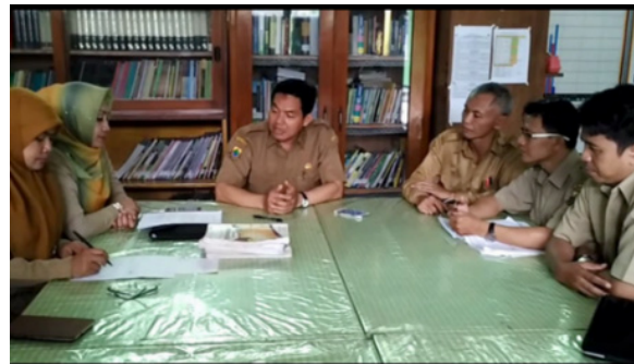
Gambar 3. Sesi Plan Kegiatan Lesson Study

Mereka merencanakan pembelajaran yang akan dilakukan dengan memperhatikan karakteristik materi, siswa dan media pembelajaran yang akan digunakan. Selain itu mereka juga menunjuk guru model untuk melaksanakan pembelajaran dalam sesi Do (Open Lesson) . Berikut ini disajikan ilustrasi sesi plan seperti pada Gambar 3.