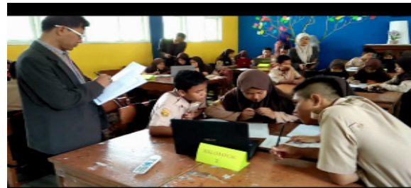
Gambar 4. Sesi Do Kegiatan Lesson Study

Setelah sesi plan kemudian dilanjutkan dengan sesi Do , yaitu pembelajaran yang dilakukan oleh seorang guru model, guru lainnya, mahasiswa dan peneliti menjadi pengamat seperti terlukispada Gambar 4. Pada sesi ini guru model melaksanakan pembelajaran sesuai dengan yang direncanakan pada sesi plan . Para pengamat memantau aktivitas siswa pada kelompok tertentu. Aktivitas yang diamati meliputi kemampuan siswa dalam berkolaborasi, berkomunikasi, berpikir kritis dan berpikir kreatif.